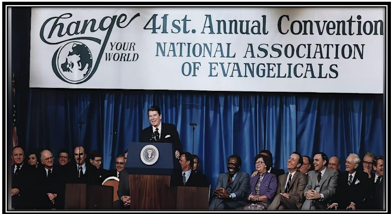
Bài phát biểu của Tổng thống Ronald Reagan các đây 40 năm

Hãy cùng VOC khám phá bài phát biểu về Đế chế Ác ma của Tổng thống Ronald Reagan 40 năm.